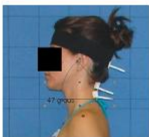
Figura 1. Análise do ângulo C7-trágus-horizantal, formado entre a linha traçada de C7 ao trágus e a horizontal.